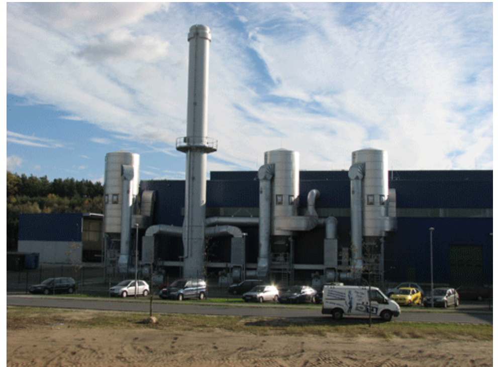
Entstaubungsanlage für Müllverbrennung und –aufbereitung