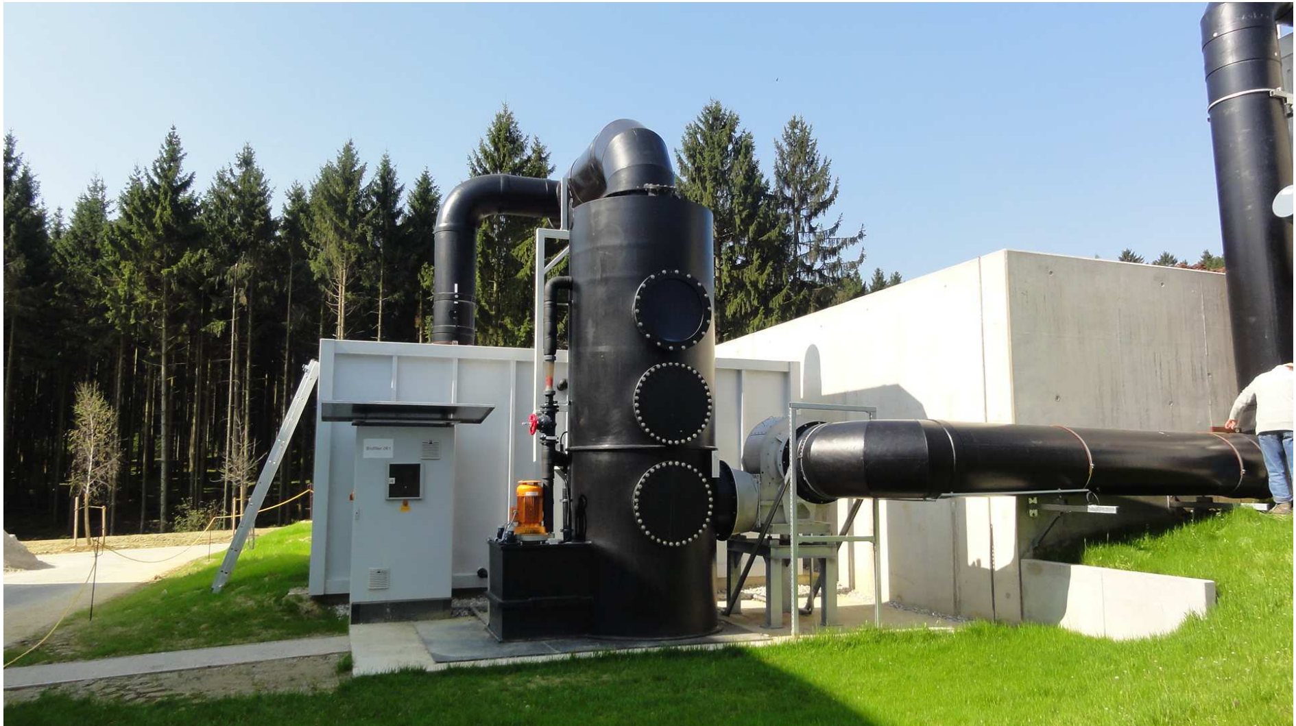
Abluftwäscher mit Biofilter