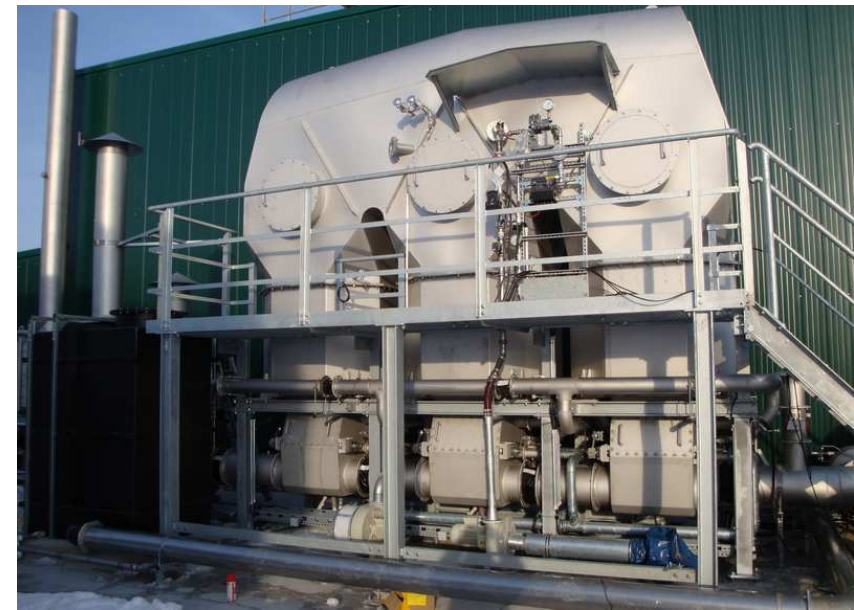
realisierte RTO – Anlage