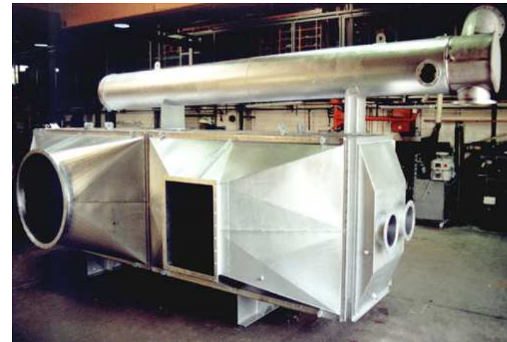
Gehäuse für Wärmetauscher, gefertigt aus hoch hitzebeständigem Edelstahl