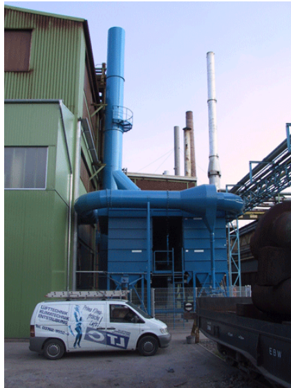
Filteranlagen für Gießereistäube