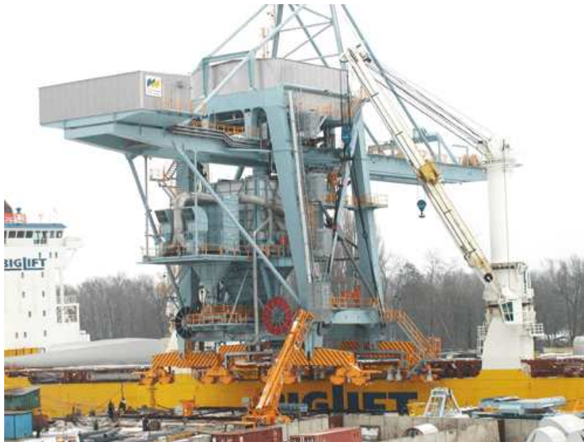
Entstaubungsanlage für Schüttgutverladung im Hafen von Fremantle