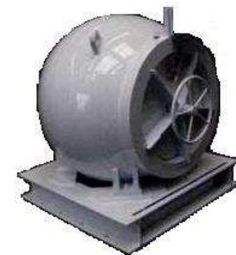
Kammer für die Bombenentschärfung

Der Jahresumsatz liegt zwischen 7 und 8 Millionen Euro.